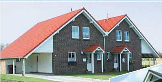
↑ Hier führten wir die Maurer- und Betonarbeiten aus.