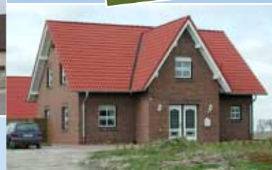
← Hier führten wir den Rohbau aus. Architekt: Dipl.-Ing. Frank Sandhorst