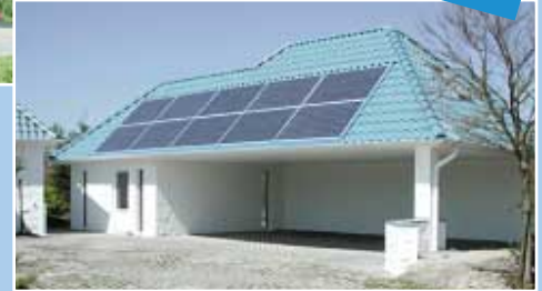
Hier führten wir den Rohbau aus. ↑